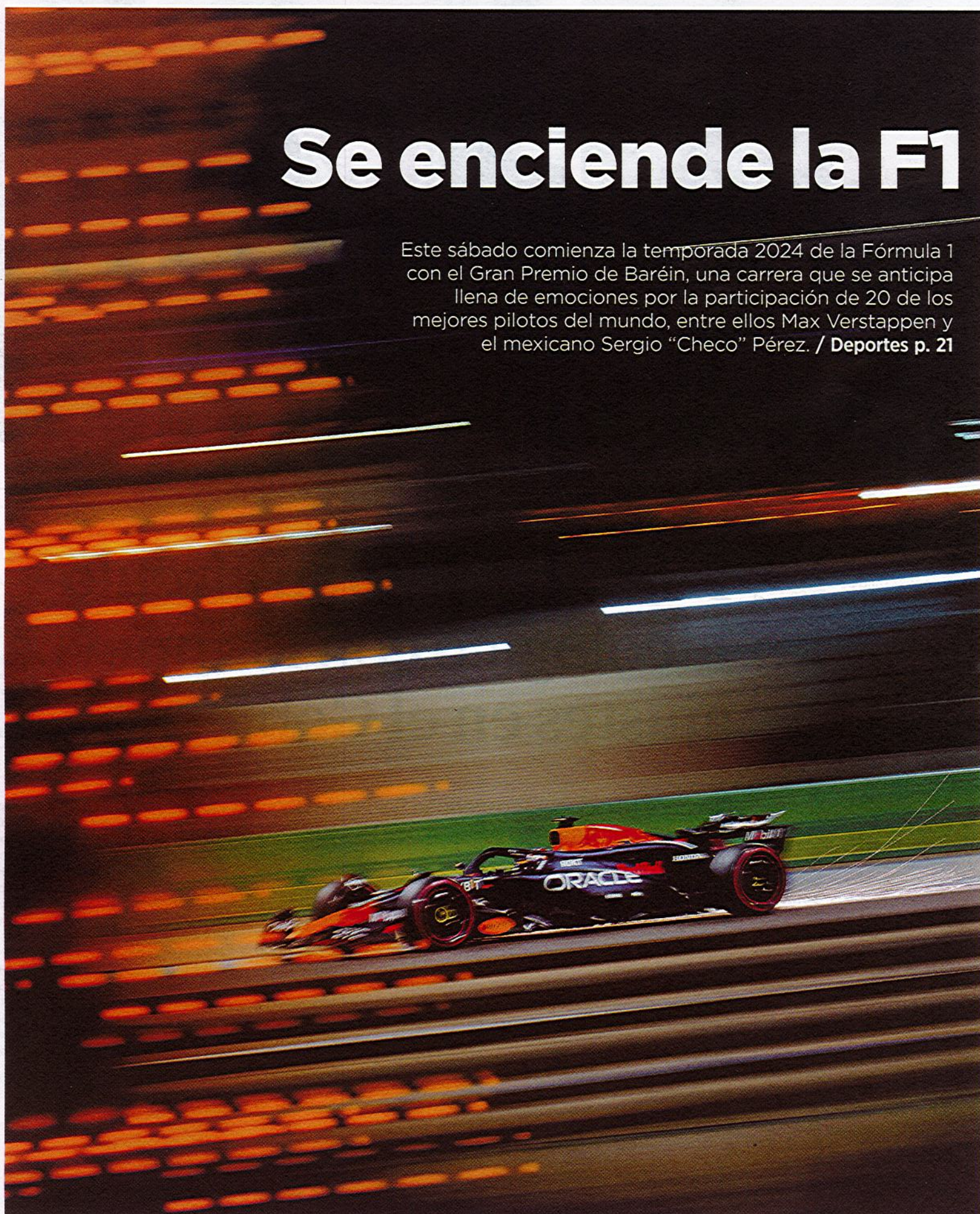
El neerlandés Max Verstappen durante una práctica libre en la zona del desierto de Sakhir, previo al Gran Premio de Baréin.

Este sábado comienza la temporada 2024 de la Fórmula 1 con el Gran Premio de Baréin, una carrera que se anticipa llena de emociones por la participación de 20 de los mejores pilotos del mundo, entre ellos Max Verstappen y el mexicano Sergio "Checo" Pérez. / Deportes p. 21